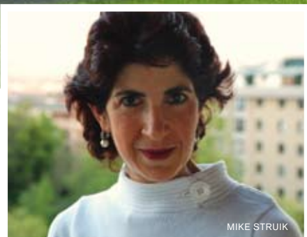
➔ Fabiola Gianotti

Studiare l'infinitamente piccolo, la struttura della materia, per capire l'infinitamente grande, l'Universo: ecco l'obiettivo di LHC, l'acceleratore di particelle più famoso al mondo. Per raggiungerlo, sono al lavoro da anni migliaia di scienziati, tra competenze avanzatissime, entusiasmo e un pizzico di impazienza.